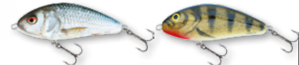
RD - Real Dace