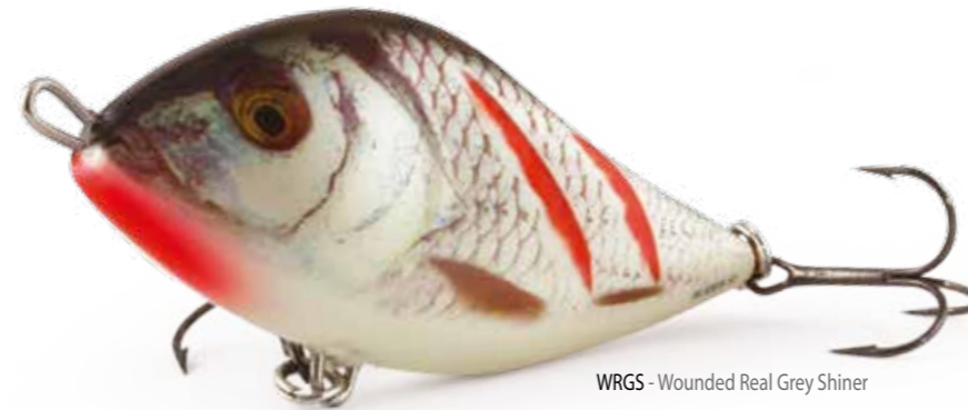
WRGS - Wounded Real Grey Shiner

In tutta onestà, possiamo dire che con lo SLIDER inizia una nuova era nel campo delle esche artificiali. Sia il profilo esclusivo (il più copiato da altri produttori di artificiali) che la sua fantastica azione, unica nel suo genere, garantiscono un'attrazione fatale su tutti i pesci predatori. La caratteristica saliente dello SLIDER è che non esiste un metodo sbagliato per utilizzarlo. Tutte le tecniche di recupero si sono rivelate efficaci con esso!