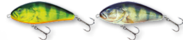
RHP - Real Hot Perch