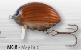
MGB - May Bug