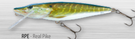
RPE - Real Pike