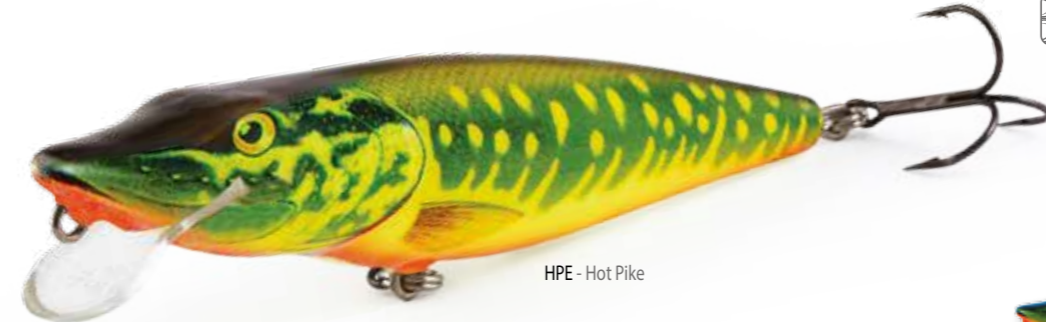
HPE - Hot Pike

Il nostro crankbait PIKE Salmo non è associabile a nessun altro artificiale, sia in termini di perfetta imitazione della colorazione di un luccio che per l'azione specifica, che ha dimostrato di essere irresistibile per qualsiasi esocide che capita nei paraggi dell'esca. Disponibile nelle versioni solida e jointed.