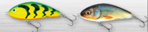
GT - Green Tiger