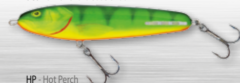
HP - Hot Perch