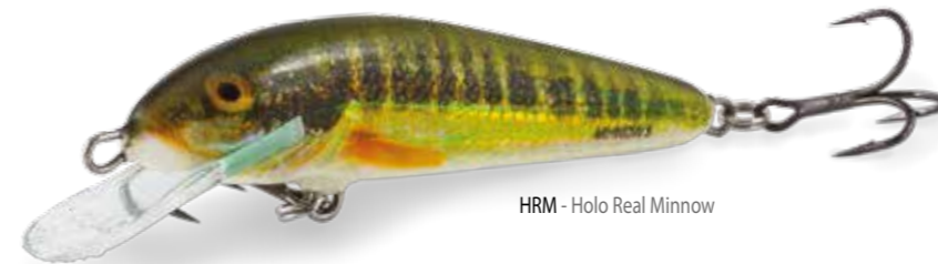
HRM - Holo Real Minnow

È caratterizzato da un'azione abbastanza stretta e ad elevata frequenza, un artificiale universale che può essere utilizzato in molti modi per adattarsi alle vostre preferenze. Ideale per catturare tutti i predatori, in tutti i tipi di ambienti, il MINNOW è disponibile in versione galleggiante, affondante e anche "Super Deep Runner", per il trolling.