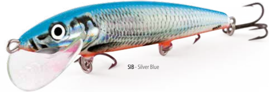
SIB - Silver Blue