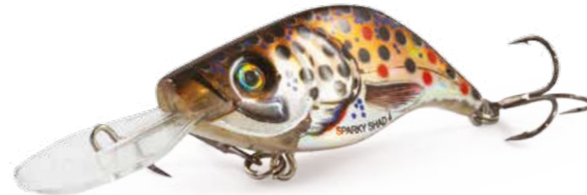
BHT - Brown Holographic Trout

Durante i recuperi a velocità ridotta, l'azione dello SPARKY SHAD è una combinazione di movimenti laterali e larghe oscillazioni della coda. Con velocità di recupero elevate, il range delle oscillazioni decresce in modo esponenziale, ma la frequenza aumenta fino al punto da non essere imitabile da nessun altro artificiale di questo tipo. Caratterizzato dal sistema "long cast", un peso interno che si muove, il quale inoltre stabilizza l'artificiale quando è fermo.