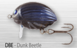
DBE - Dunk Beetle