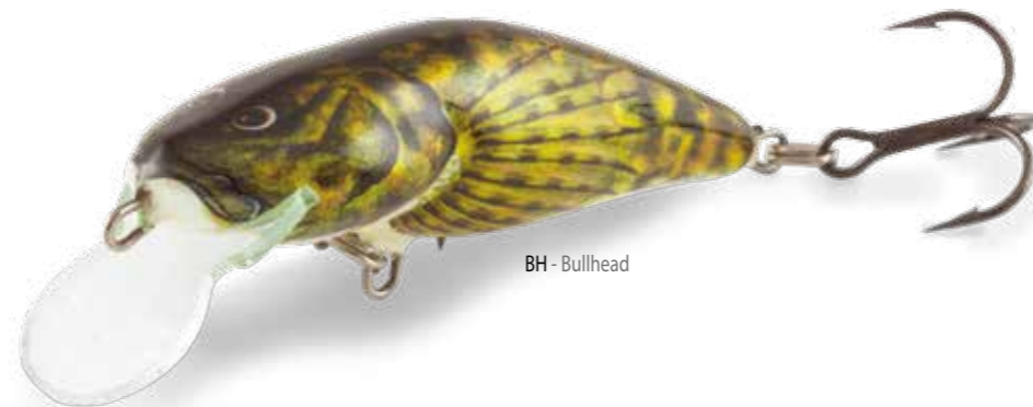
BH - Bullhead

A nostro parere, il Salmo BULLHEAD è la migliore imitazione scolpita disponibile sul mercato. Nonostante sia stato disegnato originariamente per trote marroni, si è dimostrato efficace con tutti i predatori, sia in grossi fiumi che in laghi. Senza ombra di dubbio questo è un artificiale di cui non potranno fare a meno i patiti della pesca al persico !