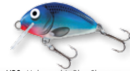
HBS - Holographic Blue Sky