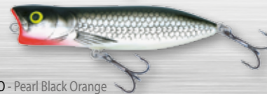
PBO - Pearl Black Orange