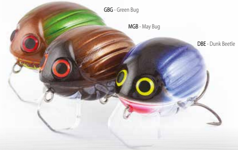
GBG - Green Bug

Questo crankbait da superficie è perfetto per i patiti della pesca con artificiali-ultraleggeri, ed è stato descritto come il miglior artificiale da cavedano. Caratterizzato da un design "long cast" – Salmo Infinity System (SICS), il modello LIL' BUG è un grande artificiale per lanciare in spazi angusti vicino a coperture, oppure per il drifting con la corrente, fino a quando la corretta posizione per il recupero non è stata raggiunta.