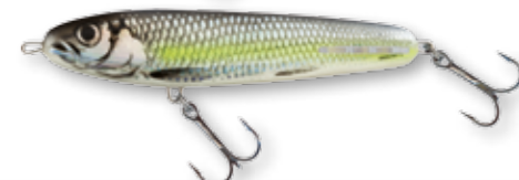
SCS - Silver Chartreuse Shad