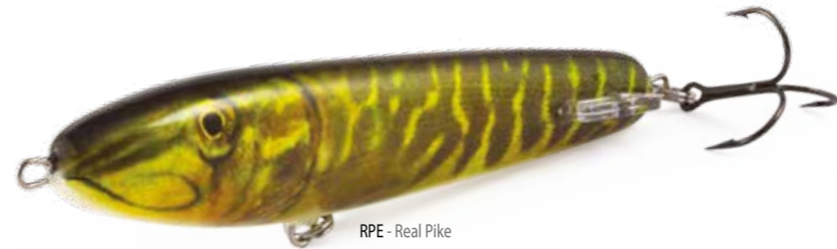
RPE - Real Pike

La fantastica azione che ricorda un pesce debole o ferito è possibile grazie al profilo unico e al perfetto bilanciamento del corpo dell'artificiale.