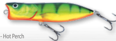
HP - Hot Perch