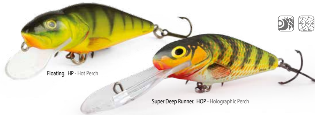
Floating. HP - Hot Perch

Questo artificiale è disponibile in molte varianti, tutte in grado di coprire svariate situazioni di pesca che gli angler si troveranno a dover affrontare.