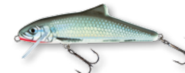
HGS - Holo Grey Shiner