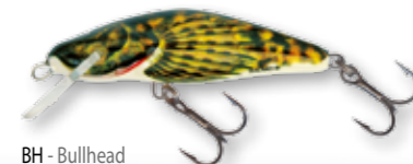
BH - Bullhead