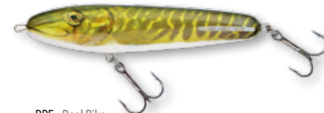
RPE - Real Pike