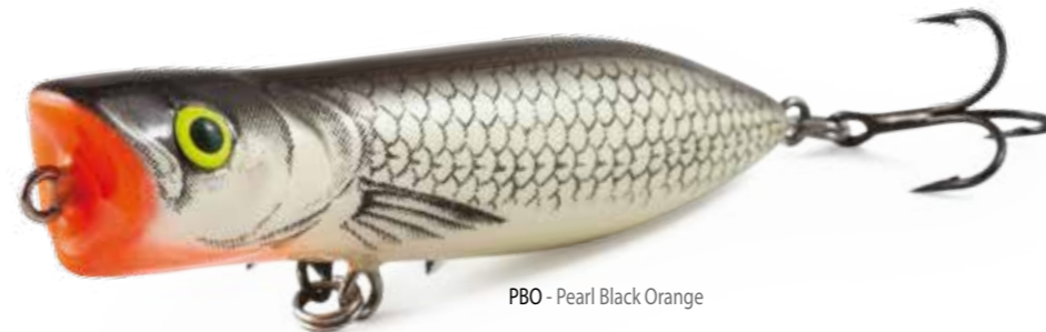
PBO - Pearl Black Orange

È un ibrido esclusivo fra popper e "stickbait" che possiede anche caratteristiche aggiuntive. La costruzione e il bilanciamento rendono la pesca con questo artificiale agevole e divertente. Non vanno inoltre trascurate le incredibili proprietà aerodinamiche del ROVER, che vi consentono di lanciare sulla superficie in cui i predatori si alimentano senza fare capire ad essi che voi siete lì.