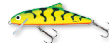
GT - Green Tiger