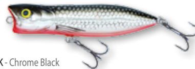
CBK - Chrome Black