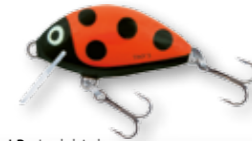
LB - Ladybird