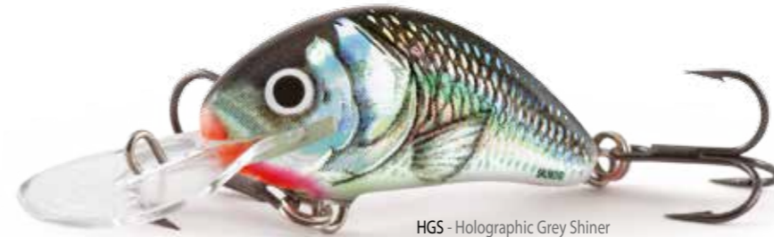
HGS - Holographic Grey Shiner

Il modello galleggiante è l'artificiale più evoluto per la pesca in acque poco profonde e attorno a strutture, con molte abboccate che avverranno nella pausa del recupero, quando l'artificiale sta risalendo.