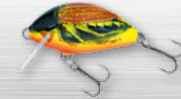
HC - Hot Cockchafer