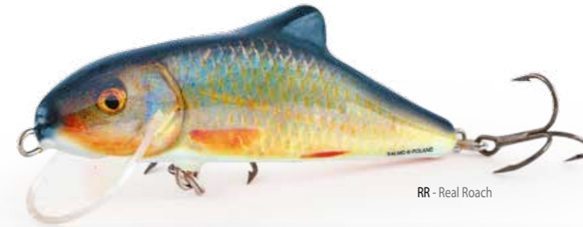
RR - Real Roach

Già dopo pochi lanci sarete deliziati da quello che può fare lo SKINNER. Non nuota troppo in profondità, ma ai grossi predatori non sembra interessare troppo questo aspetto, salgono in superficie per stritolarlo!