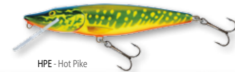
HPE - Hot Pike