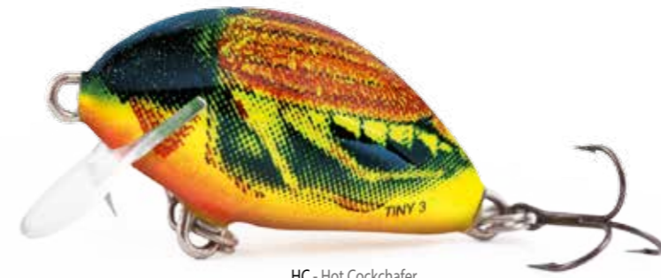
HC - Hot Cockchafer

L'azione aggressiva e una eccellente aerodinamica, rendono questo artificiale unico nel suo genere. Senza ombra di dubbio questo è l'artificiale più avanzato per i fanatici degli ultra-leggeri. Perfetto per pescare in piccoli fiumi coperti di vegetazione, specialmente quando ci si sposta, oppure per lanciare in acque ferme, questa piccola esca esercita un forte richiamo!