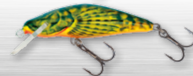
HBH - Hot Bullhead