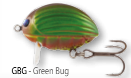
GBG - Green Bug