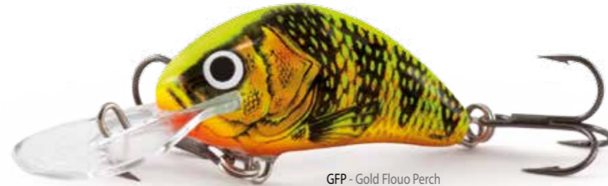
GFP - Gold Flouo Perch

La versione affondante di questo artificiale classico è perfetta per acque profonde, quando è necessario muovere l'esca negli strati inferiori della colonna d'acqua, dove si alimentano i pesci.