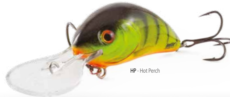
HP - Hot Perch

Potete aspettarvi la stessa azione efficace e potente del HORNET originale ma con l'aggiunta di un suono attrattivo per i pesci. Il sonaglio integrato e il sistema "long cast" SICS sono attributi che rendono questo crankbait un'arma universale, multi-funzione, che può essere utilizzata per catturare qualsiasi predatore.