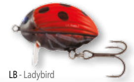
LB - Ladybird