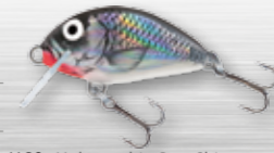
HGS - Holographic Gray Shiner