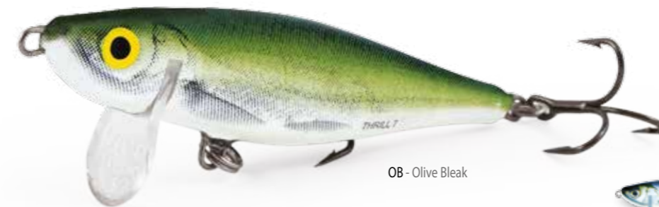
OB - Olive Bleak

Grazie alla forma e all'azione veloce ad elevata frequenza, è veramente difficile distinguere questo artificiale da un pesce vivo. Il peso aumentato e una aerodinamica esclusiva, consentono ora di potere raggiungere a lancio pesci inavvicinabili in passato. Il THRILL lavora bene anche con altri predatori alla caccia di piccoli pesci preda.