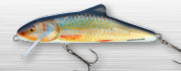
RR - Real Roach