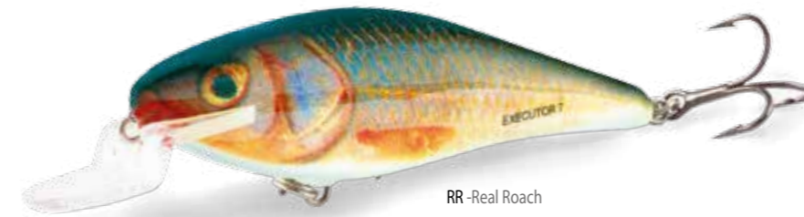
RR -Real Roach

Il profilo collaudato e l'azione della coda priva di difetti, sono due regali che dovrebbero convincere chiunque a provare l'EXECUTOR. Questo runner per acque poco profonde può essere utilizzato in prossimità della superficie quando impiegato con un recupero ad "impulsi", oppure controllato a velocità variabile per coprire i primi metri della colonna d'acqua, dove i predatori sono spesso in attesa di attaccare. Con quattro misure disponibili, questo range di artificiali copre tutte le specie, dal persico al luccio!